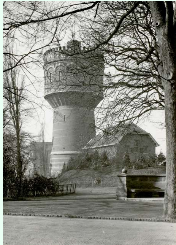
Historisch beeld met situering van RADIUS in de watertoren en het pomphuis in het Kalverbos te Delft. De watertoren dienst als kantoorplaats voor RADIUS en biedt tevens ruimte voor educatieworkshops en publieksevenementen.

Jaarlijks presenteren we een ambitieuze programmering van groepstentoonstellingen, solopresentaties, een