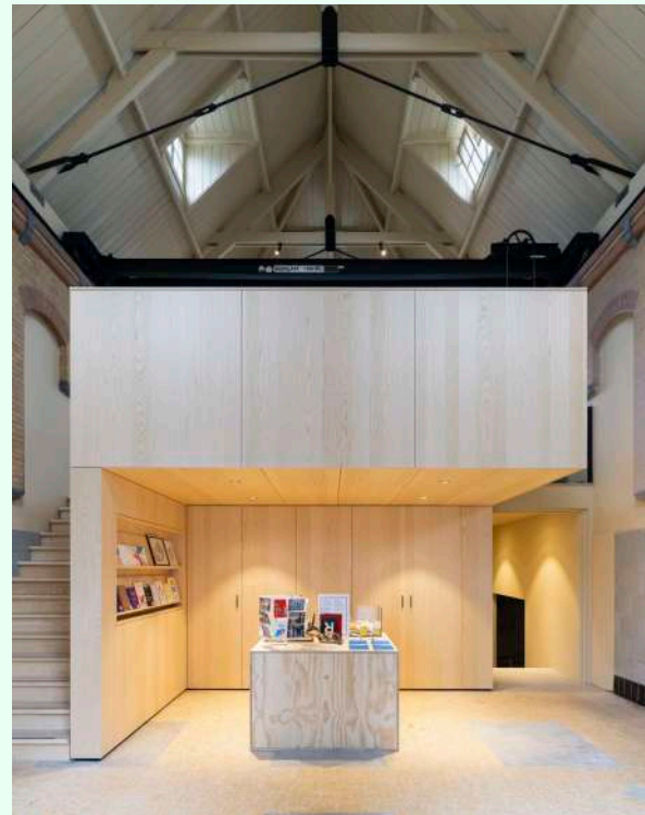
Bovenstaande beelden: Interieur pomphuis met entreegebied RADIUS, waaronder receptie en boekwinkel.