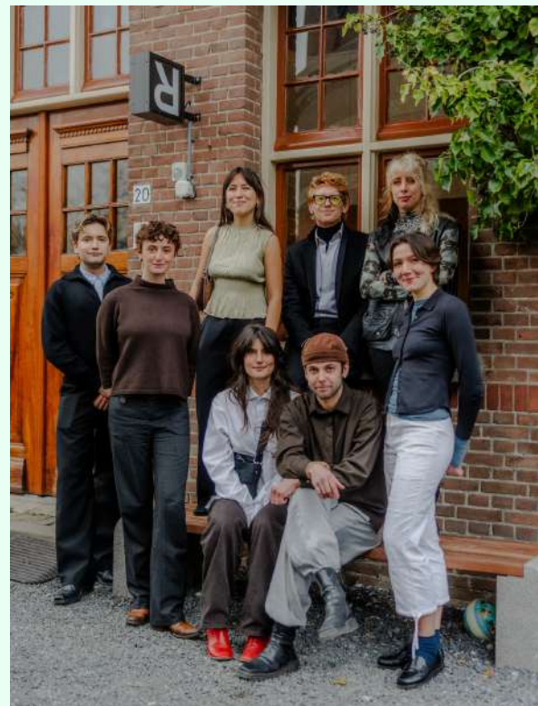
Foto kernteam RADIUS, maart 2026.