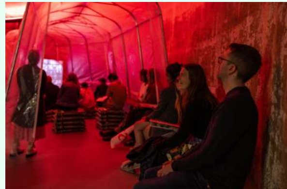
Bovenstaande beeldselectie: Documentatie van presentaties en openingsrecepties bij RADIUS in 2022 en 2023.