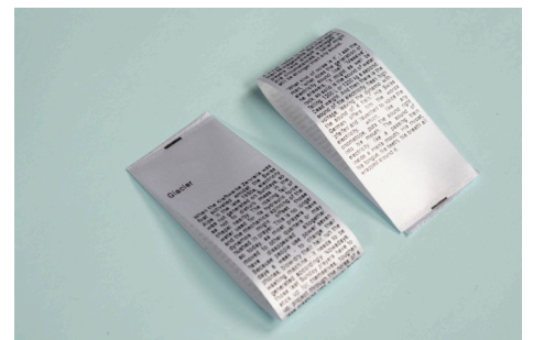
Micro-essays die als wasvoorschriften aan T-shirts gestikt zijn.