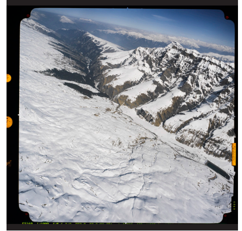
Luchtfoto omgeving Safien dal, uit het publieke archief van Vals, Zwitserland, 2003.

Als we spreken over ecologisch verdriet, hoe maken we dit dan vervolgens invoelbaar als we het hebben over een plek 'elders'—zoals een smeltende Zwitserse gletsjer—die ons niet direct lijkt te raken in ons bestaan in Nederland? Als we ons beseffen dat temperatuurstijging (veroorzaakt door klimaatverandering en de menselijke uitstoot van koolstofdioxide) een globaal fenomeen is met grillige plaatselijke uitwassen, wat doet dat vervolgens met ons gevoel van medeplichtigheid? Evenals de vreemde intimiteit tussen ons energieverbruik enerzijds, tegen de achtergrond van onze afbrokkelende directe leefomgeving anderzijds? Met andere woorden, wat is de correlatie tussen een nachtelijke blik in de ijskast en de slinkende gletsjer die vele honderden jaren het landschap bepaalde?